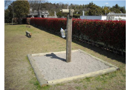
犬用トイレ2基設置