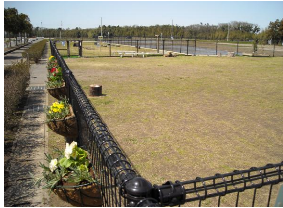
③方向より撮影:小型犬専用エリア