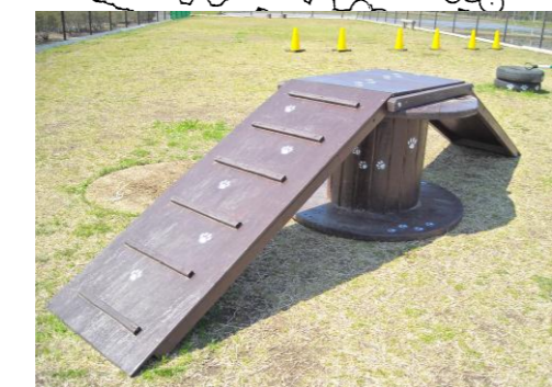
廃材により簡易遊具を製作