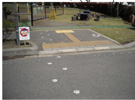
足型ペイントによる視線誘導表示