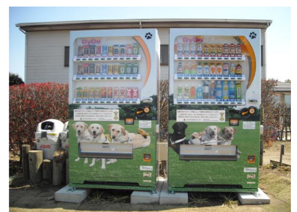
休憩広場には盲導犬センターへの