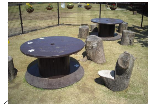
②方向より撮影:休憩広場 テーブル、イスは廃材や伐採木を流用