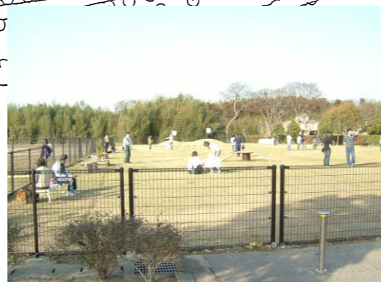
①方向より撮影:フリーエリア