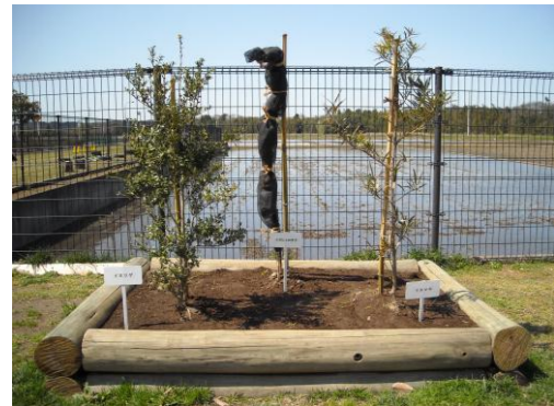
植栽の紹介(イツゲ・イヌマキ・イヌシュロチ)