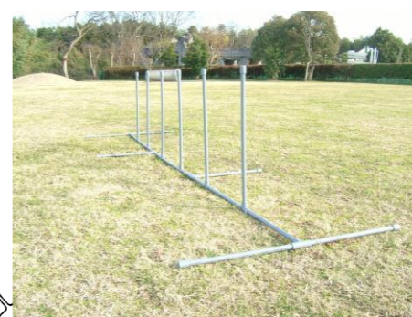
塩ビ管でスラロームを製作